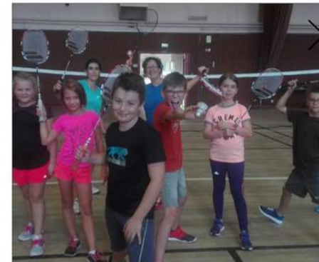
Les jeunes sont déjà fous du volant deux fois par semaine à l'espace Flambeau.

Le club se développe doucement mais sûrement. Les créneaux adultes ont lieu lundi et jeudi, à l'espace Flambeau, de 19 h à 21 h 30 et le mercredi au Cosec, de 19 h 30 à 21 h 30. Les cotisations sont fixées à 75 € pour les enfants jusqu'à la catégorie junior et 90 € pour les adultes. Les adultes c'est du loisir et un peu de compétition avec deux équipes engagées pour la deuxième année au niveau départemental.