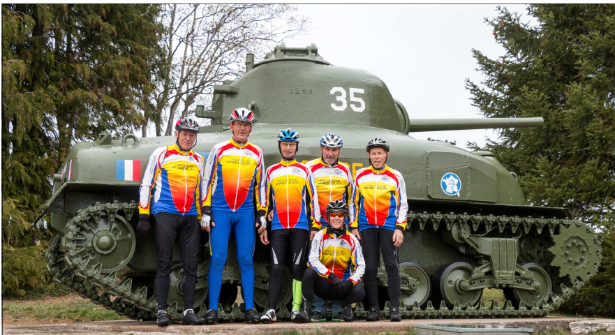
Le Cyclo-Club devant un des nombreux chars de la bataille de Dompain

Ce projet, piloté par le PETR de l'Ouest des Vosges, soutenu par l'Europe via les fonds LEADER, a tout d'abord été présenté en février 2019 au pôle culturel dompainois de la communauté de communes Mirecourt-Dompain avant d'être finalisé pour le 75 e anniversaire de la libération de toutes les communes de la Plaine où sont implantées les bornes de la voie de la 2 e DB. Cérémonies commémoratives auxquelles le club a été invité et a participé le 15 septembre.