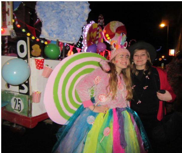
Le char Effort Basket-OMS